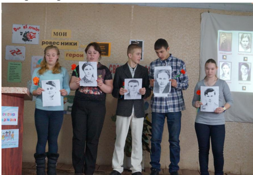
9 класс рассказывает о Молодой гвардии

*Что бы вы сказали своему ровеснику герою ВОВ сегодня?