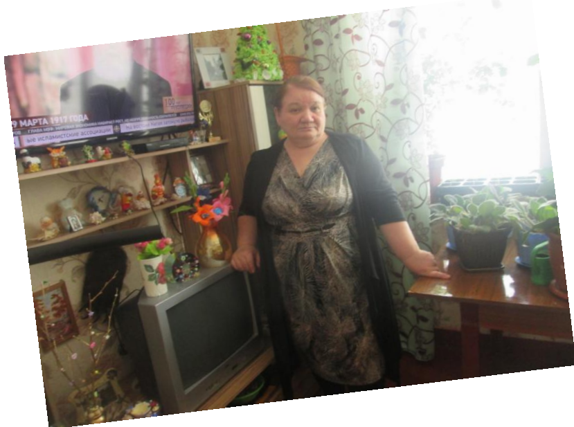
Екатерина Алексеевна и её работы