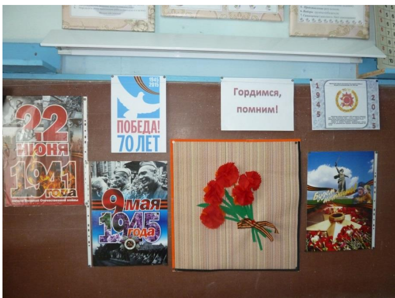
Фото 1. Вернуться к тексту

Ценность данного мероприятия ещё и в том, что дети сами принимали активное участие в подготовке и проведении Урока Победы.