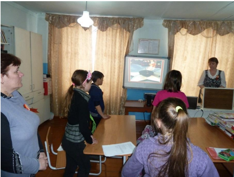
Фото 3. Вернуться